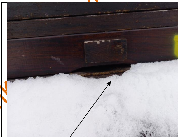
Flugloch ist frei: auch bei geschlossenem Boden besteht kein Handlungsbedarf